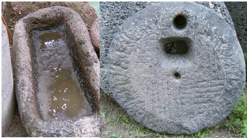
Рис. 7 – Корыто и детали жернова, выдолбленные из целых кусков туфа (с. Богатырка)

Несмотря на то, что корейцы селились компактно, своими общинами, они достаточно активно вели торговлю с местным населением. Продавали, прежде всего, излишки выращенного урожая, иногда мясо, а также обменивали свою продукцию на другие товары повседневного спроса. Это неизбежно приводило к культурному обмену с русскими, китайцами, удэгейцами, нанайцами и другими народами.