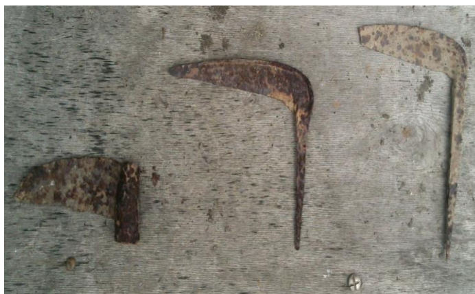
Рис. 7 – Различные виды серпов для уборки урожая риса и др. зерновых культур, найденные в с. Пуциловка (вверху) и с. Монакино (внизу).

Одними из наиболее удобных и выгодных для сельскохозяйственного освоения мест стали земли современной Пуциловской территории, расположенные вдоль р. Казачки и граничащие с Корсаковской территорией, а также с Октябрьским районом (с. Синельниково и др.). Эти территории стали активно осваиваться корейцами еще в 60-х годах XIX века, а уже к концу столетия здесь проживали многочисленные семьи оседлых земледельцев. Примером может служить семья уроженца с.