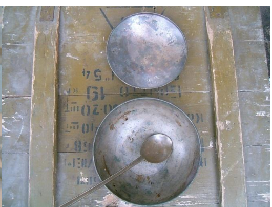
Рис. 3 – Латунные ложки и чашки (с. Пуциловка и с. Монакино)

По наблюдениям Н.М. Пржевальского корейские деревни состояли из фанз, расположенных друг от друга на расстоянии 100-300 шагов. По его мнению, снаружи и внутри эти дома практически ничем не отличались от китайских. Между фанзами располагались поля. «Все полевые работы производятся на коровах и на быках, но плуги весьма дурного устройства, так что работа ими тяжела как для скотины, так и для человека» . Корейские крестьяне для выращивания риса, бобов, фасоли, ячменя и овощей в Приморье применяли традиционную технологию, используемую в Корее [9, с.132, 10]. Найденные