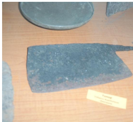
Рис. 1 – Кухонный нож (с. Пуциловка)