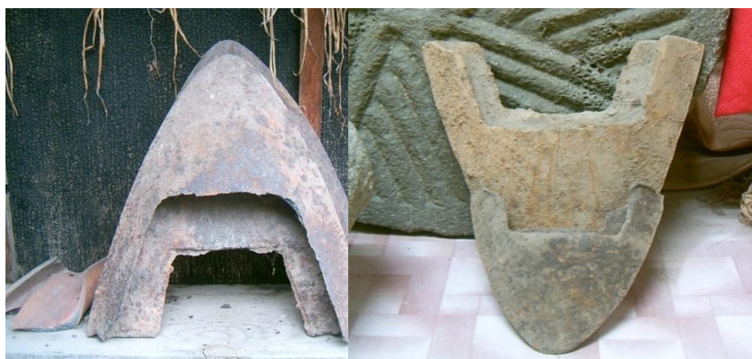
Рис. 6 – Лемеха-плоскорезы для обработки почвы (с. Монакино, с. Пуциловка)

Кроме того, плоскорезы соответствующего размера можно было применять также для междурядной обработки почвы в междурядьях кукурузы, и других ширококорядных культур. В качестве тягловой силы использовали крупный рогатый скот. Коров они не доили, так как молока не употребляли в пищу.