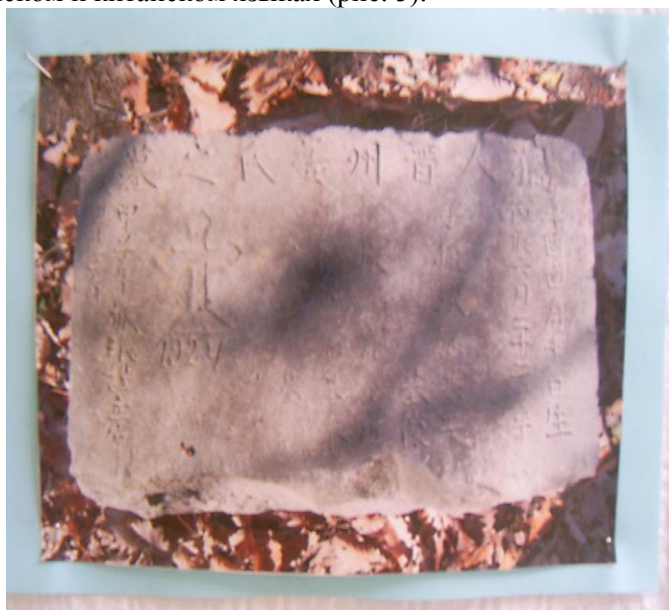
Рис. 5 – Надгробие корейской могилы, 1924 г. (с. Пуциловка)

Одним из свидетельств освоения корейцами Пуциловской территории служат обнаруженные сотрудниками Пуциловской средней школы и энтузиастами старинные корейские захоронения. Характерные надгробия в виде каменных плит имели надписи на корейском и китайском языках (рис. 5).