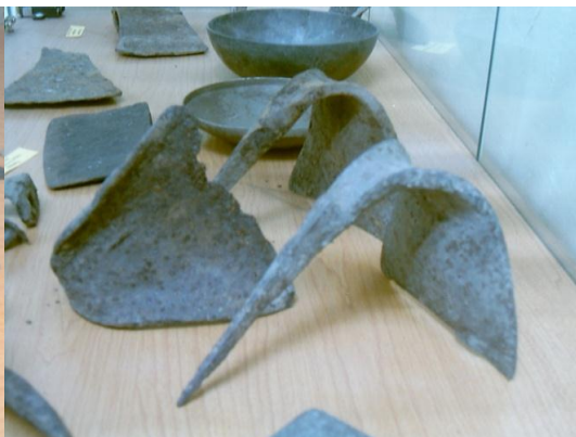
Рис. 2 – Тяпки для рыхления и прополки узких междурядий (с. Пуциловка)