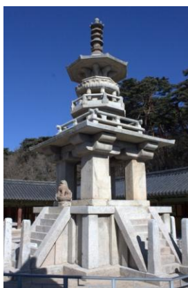
Башня Табо (다보탑)

Сравнивая форму строения корейских пагод, можно заметить, что от индийских башен корейская архитектура переняла строение верхней части башен, а основную часть многоярусной конструкции переняла от китайских пагод.