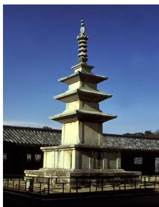
Ступа с останками Будды Шакьямуни (석가탑)

За основу строения корейских пагод была взята основа ступы с останками Будды Шакьямуни (석가탑), а также башня Табо (다보탑). Ступа с останками Будды Шакьямуни по форме своей имеет простой и лаконичный вид, в то время как башня Табо очень сложное и необычное архитектурное строение, в связи с чем вариант первой архитектурной формы намного чаще использовались при построении пагод. Башня Табо была ненадежна в плане конструкции, по причине того, что не подходила для местной почвы.